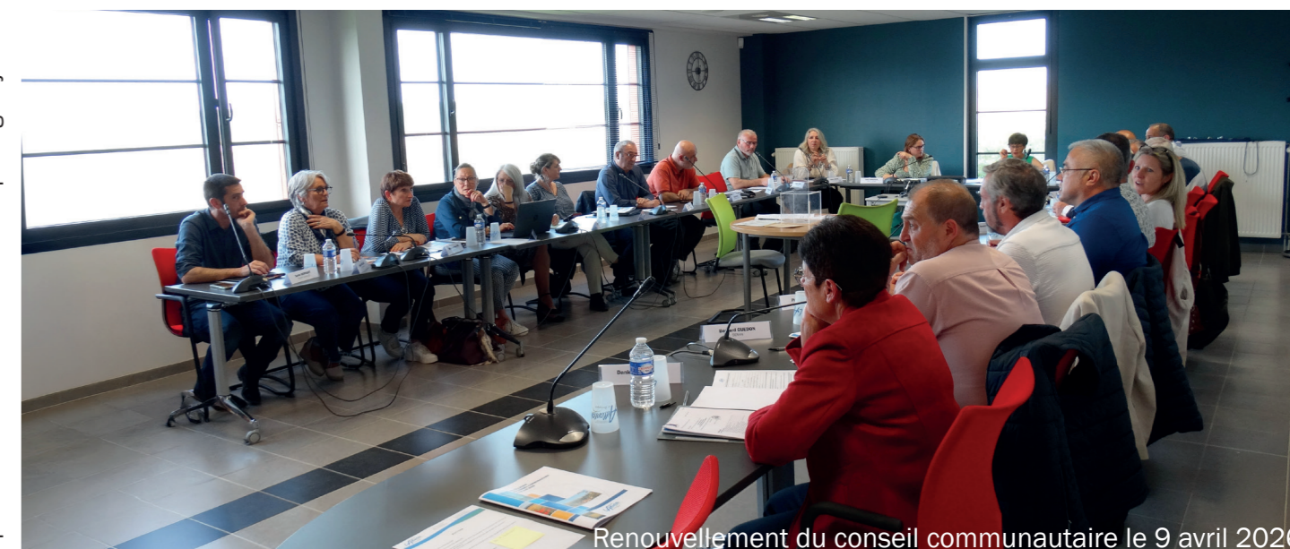
Renouvellement du conseil communautaire le 9 avril 2026