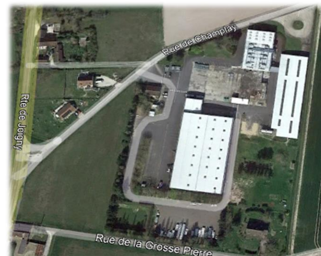
Zone d'activités « Les Terres de la Chapelle » Commune de Senan

2 zones d'activités communautaires, et 13 zones économiques villages, délimitées dans le PLUi, document d'urbanisme couvrant le territoire