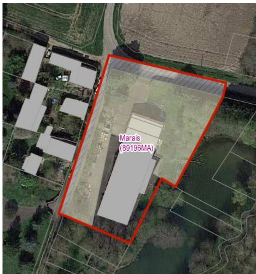
Valravillon – Guerchy