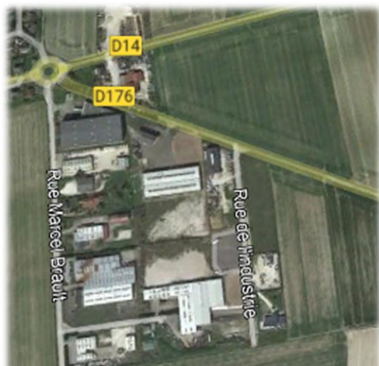
Zone d'activités « Les Hauts de Fins » Commune de Montholon

Un tissu économique hétérogène, réparti sur l'ensemble du territoire, mais qui ne représente que 2% du tissu économique de l'Yonne. Situé à l'écart des grands pôles industriels, il n'en demeure pas moins dynamique, notamment dans les domaines de l'artisanat, du commerce et des services.