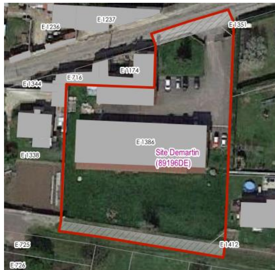
Valravillon – Neuilly