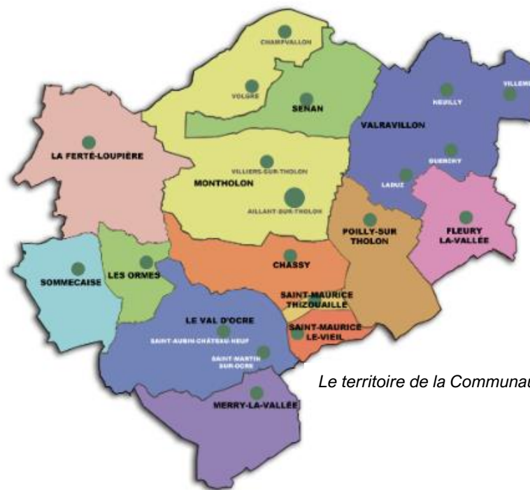
Le territoire de la Communauté de Communes