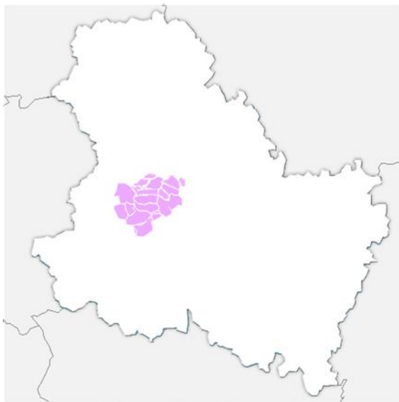
La Communauté de Communes de l'Aillantais en Bourgogne dans le Département de l'Yonne (89)

Elle s'étend sur 265 km 2 , et accueille 10 250 habitants au 1 er janvier 2023 ( statistiques INSEE ).